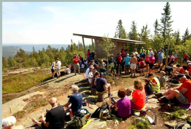
Aldri har det vært flere oppe på Gjevlekollen samtidig. Mer enn 150 mennesker møtte opp i solskinnet denne dagen