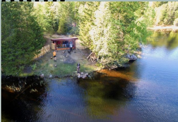
Gapahuk ved Nordsneisa, en av fire gapahuker som Statskog har satt ut i Finnemarka