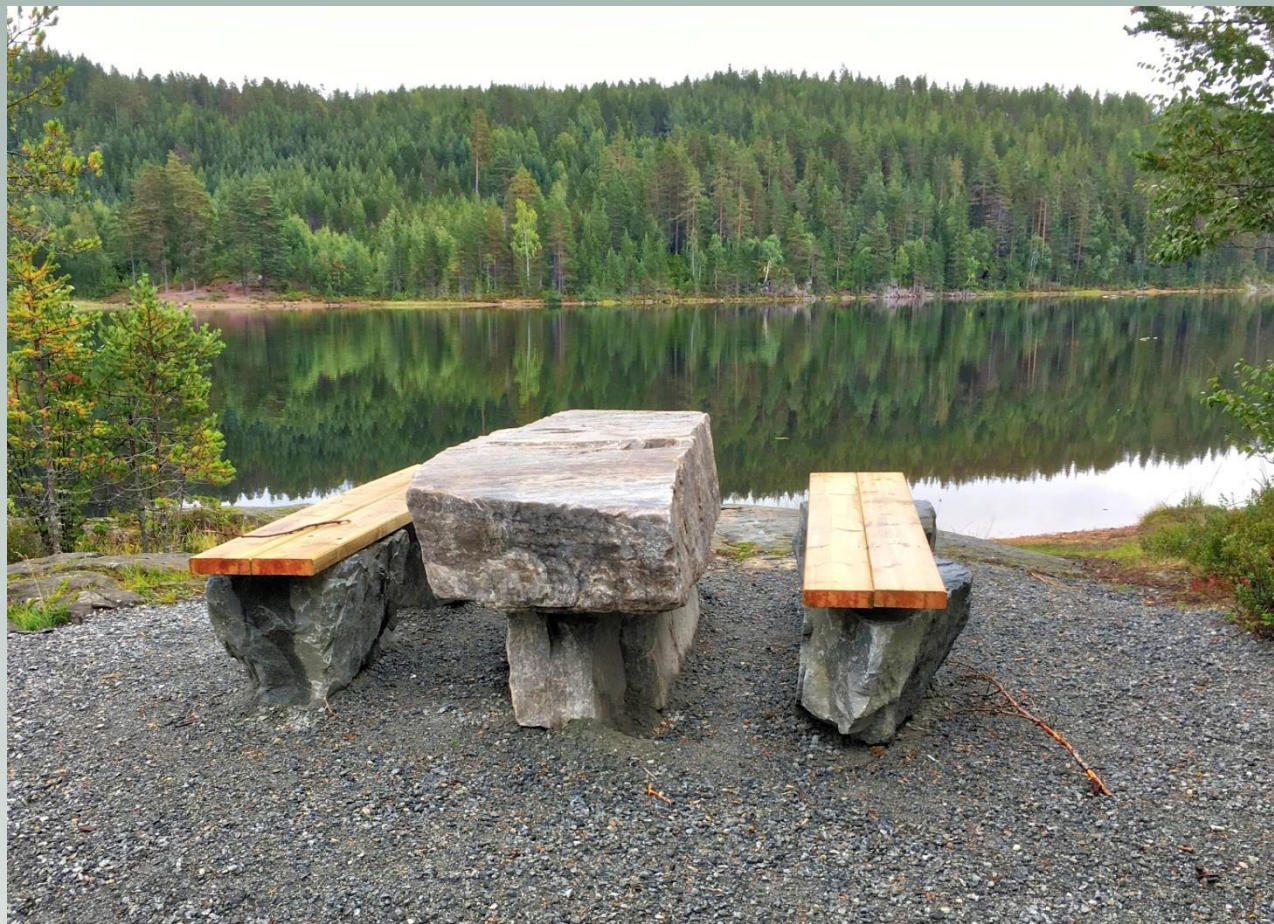
Solid bord og benker utplassert ved vannet Øksne i Sølverket statsskog i Kongsberg

Statskog vil i år eller i 2019 plassere ut steinbord med tilhørende benker ved Fallet og ved bommen på den nye parkerings-plassen på Rustanveien. Andre steder kan også være aktuelle.