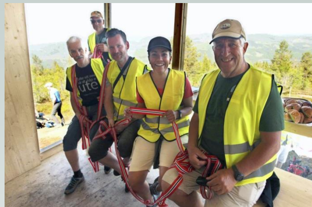
Fornøyd gjeng inne i Gjevlekollbua etter vel overstått arrangement