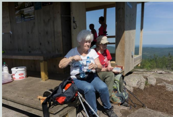
To spreke voksne damer. Den eldste godt over 80 år gammel og med brukket ankel fire måneder før turen!

Den gamle brannvakthytta som sto på Gjevlekollen før, hadde sett sine beste dager. Råte i store deler av hytta førte til at den måtte rives.