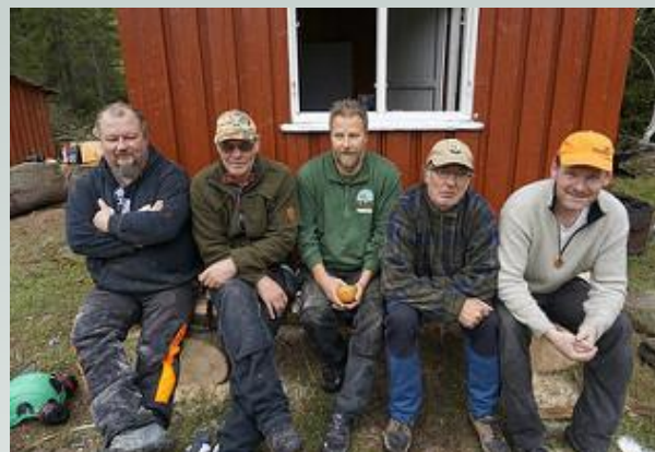
Noen av de glade dugnadsdeltagere foran nymalt hytte

Fallet er ei lita hvilebrakke som ligger om lag seks kilometer fra den nye parkeringsplassen ved Rustanveien. Brakka ligger strategisk til i forhold til både vinter- og sommerbruk, og er et lite knutepunkt i denne delen av Finnemarka.