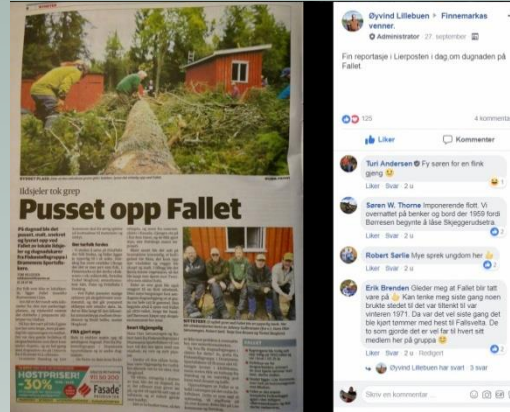
Hyggelig oppslag i Lierposten og på Facebook noen dager senere