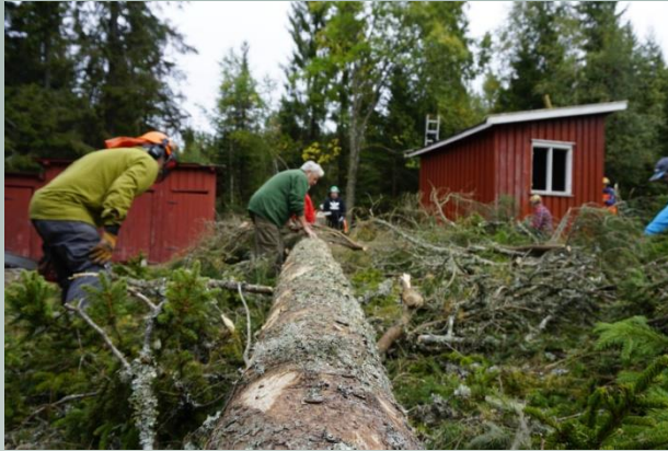
Det var dimensjoner over grana ved siden av hytta. I nærmere 140 år har den skuet utover skogene i Finnemarka