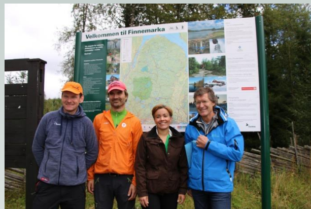
Høytidelig åpning av infotavle på Eiksetra. Disse tavlene er et resultat av samarbeid mellom Glitrevannverket, DNT Drammen og Statskog

Statskog har, alene og sammen med lokale aktører fått gjort mye for friluftslivet i Finnemarka i tiden før 2018.